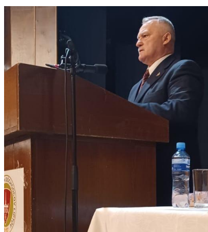
M. ÁČ priblížil činnosť Oblasťnej organizácie SZPB