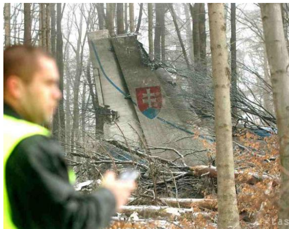
Pozostatky obetí havárie vojenského lietadla AN-24 na kopci Borsó pri obci Hejce