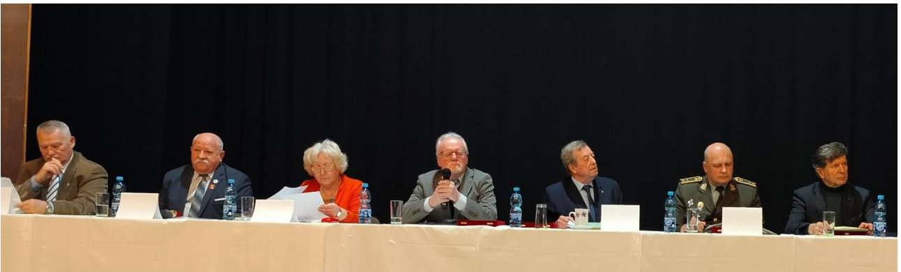
Pohľad na predsedníctvo rokovania členských schôdzí