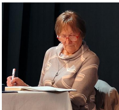
Priebeh schôdzí podrobne zapísala p. V. LOŽEKOVÁ