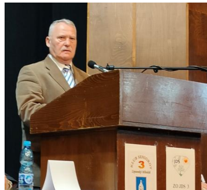
O činnosti Obl. org. SZPB informoval p. M. ÁČ